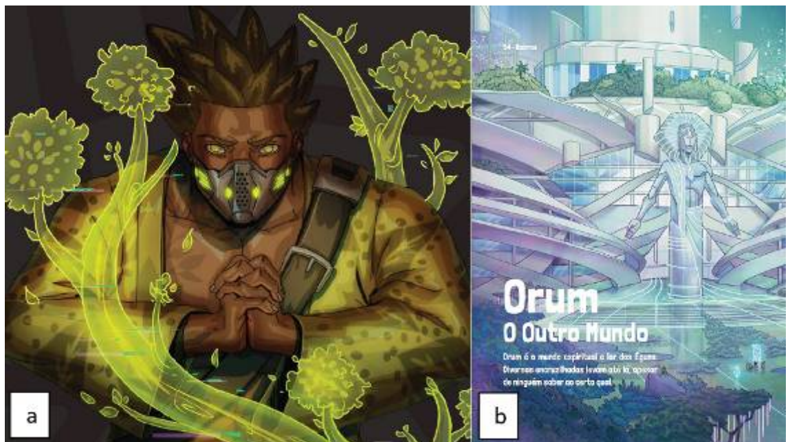
Figura 7: Ilustrações de Mojubá

Cerca de metade das ilustrações ocupam páginas inteiras, muitas vezes sangrando as margens. Diversas apresentam características de ilustrações informativas, como aquelas que introduzem as descrições de regiões do mundo secundário, auxiliando o leitor a compreender a proposta do cenário. Essas imagens destacam, por exemplo, a coexistência de arquitetura futurista, manifestações sobrenaturais e áreas de vegetação exuberante (Figura 7b).