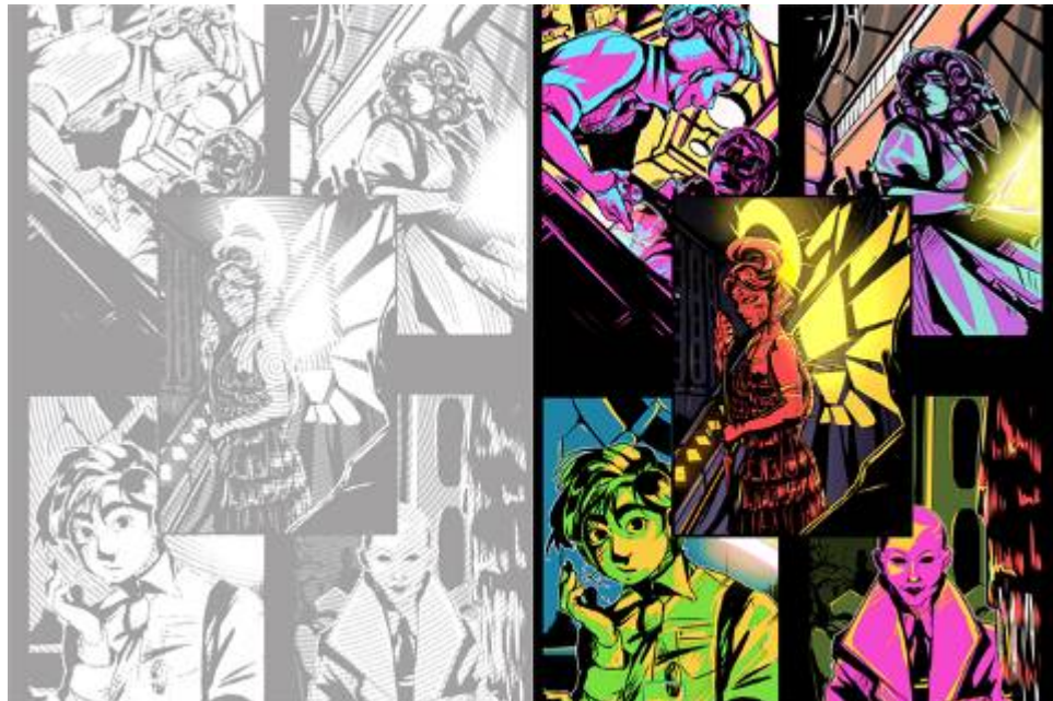
Figura 6: Duas versões de ilustração de página cheia, usadas na divisão entre capítulos