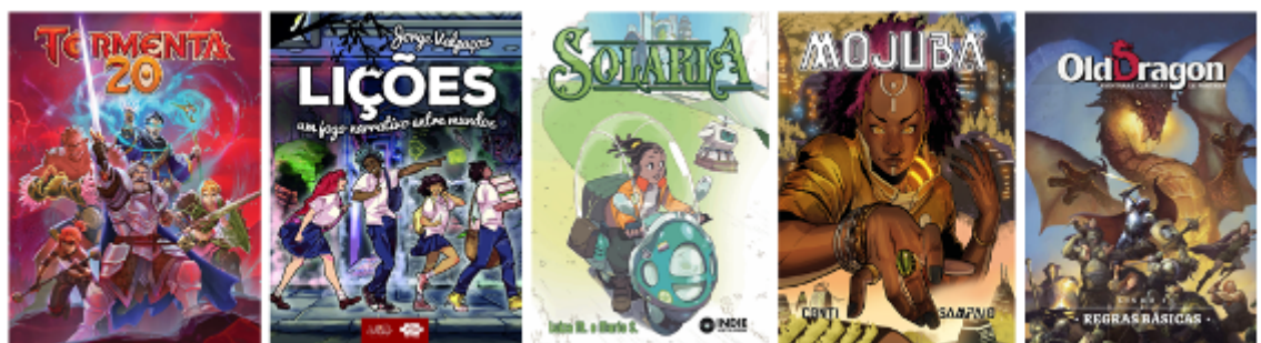
Figura 1: Livros selecionados para a análise documental

A primeira característica analisada em cada obra foi a quantidade de ilustrações presentes em suas páginas. A relação entre o número de páginas e a quantidade de imagens pode indicar o valor atribuído às ilustrações, tanto pelo mercado editorial quanto pelo público leitor, considerando que todos os livros selecionados (Figura 1) foram viabilizados por meio de campanhas de financiamento coletivo.