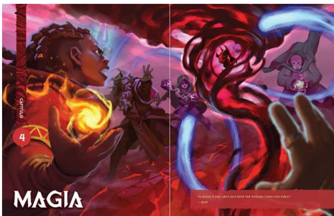
Figura 2: Ilustração de página dupla que abre o capítulo 4 de Tormenta 20

O livro publicado como resultado desse financiamento tem 400 páginas, miolo colorido em papel couché, encadernação em capa dura com aplicação de verniz localizado e sobrecapa ilustrada. Ao todo, são 142 ilustrações, em sua maioria coloridas e de tamanho médio. Quinze dessas imagens ocupam páginas inteiras ou duplas, sangrando as margens, localizadas principalmente nas aberturas de capítulos. Nelas, nota-se a presença recorrente de personagens variados em termos de etnia, idade e biotipo, muitas vezes em posição de protagonismo (Figura 2).