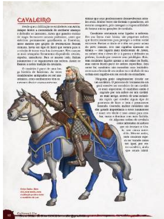
Figura 3: Ilustração de personagem idoso e PcD no capítulo de regras

ao instigar o leitor a imaginar a trajetória e as experiências desse veterano.