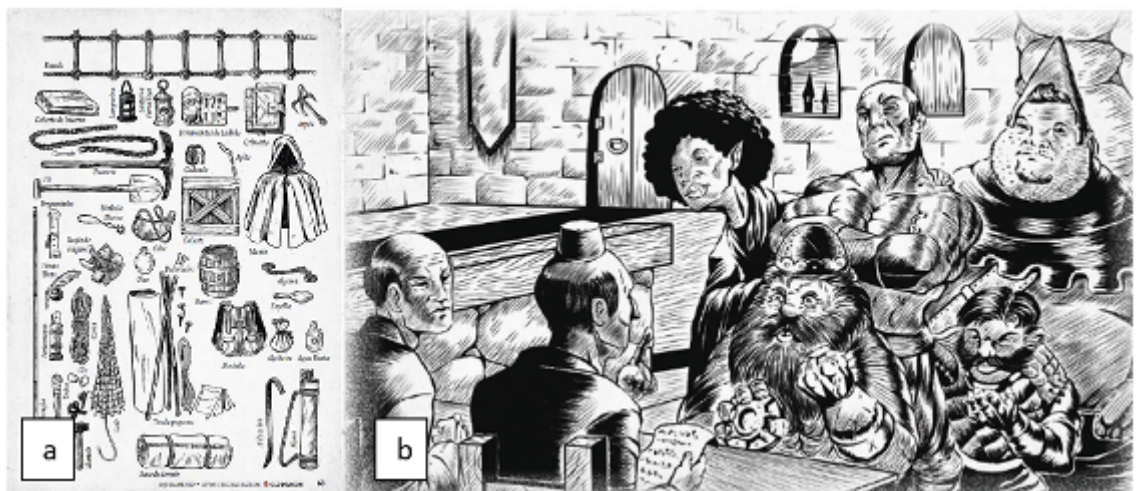
Figura 9: Ilustrações de Old Dragon

O livro utiliza poucas ilustrações de página inteira; as três existentes reúnem imagens menores alinhadas, com função sobretudo informativa. Elas situam o leitor sobre objetos citados nas regras, construindo repertório visual enquanto o texto os descreve (Figura 9a). Em preto e branco, aproximam-se da linguagem das gravuras de contos de fadas e das revistas pulp, aplicando função informativa semelhante à da Figura 4a mencionada anteriormente.